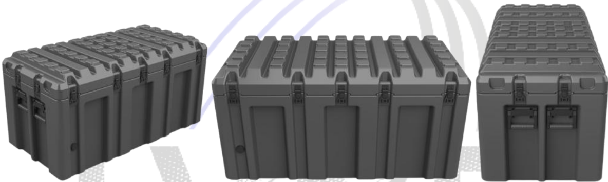
Photos de la caisse NLC-12060-5012