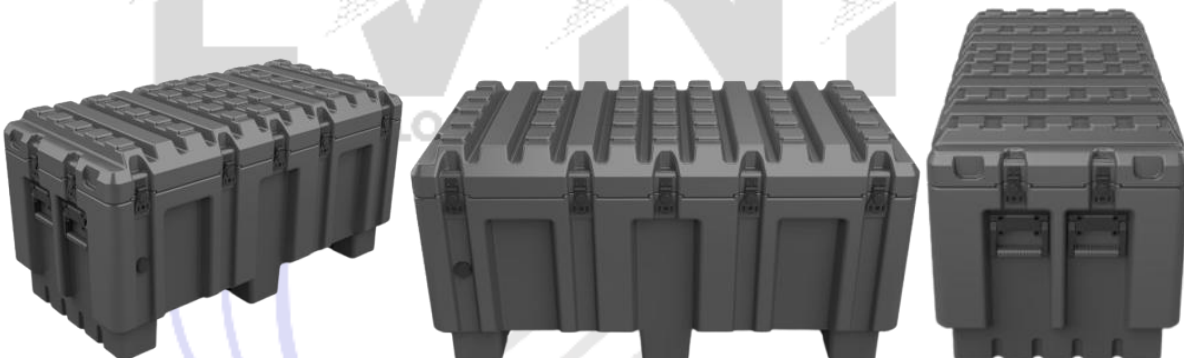
Photos de la caisse NLC-12060-5012F