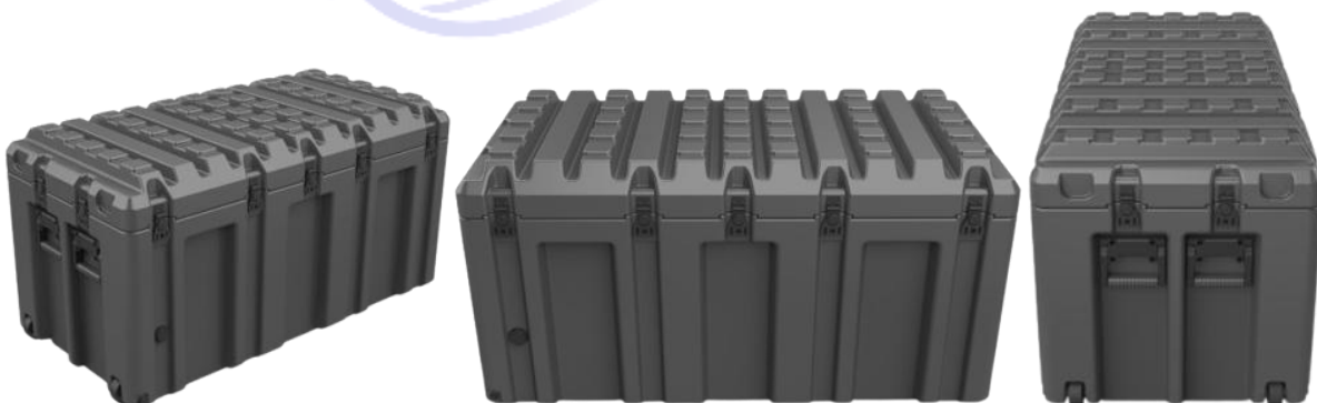
Photos de la caisse NLC-12060-5012T